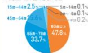
■年齢別 / 熱中症死亡者の割合